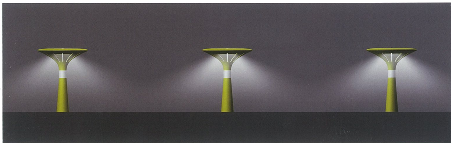
Siddepullert med lys fra designer Henrik Sørig Thomsen.

Projektet har skabt et energimæssigt godt – og æstetisk flot – grundlag for videreudvikling og produktion af nye danske byrumselementer med integreret teknologi i form af energivenligt og CO 2 neutralt lys.