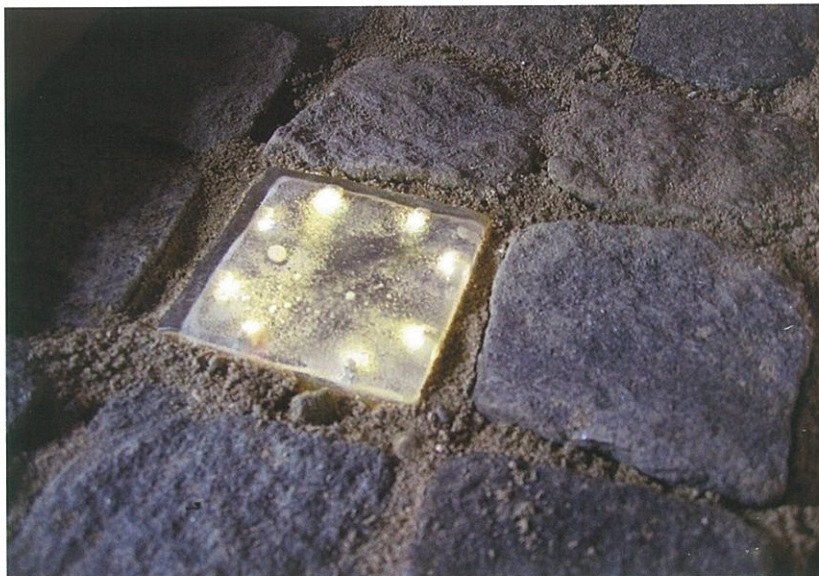
Chaussessten med lys fra Faktor 3.